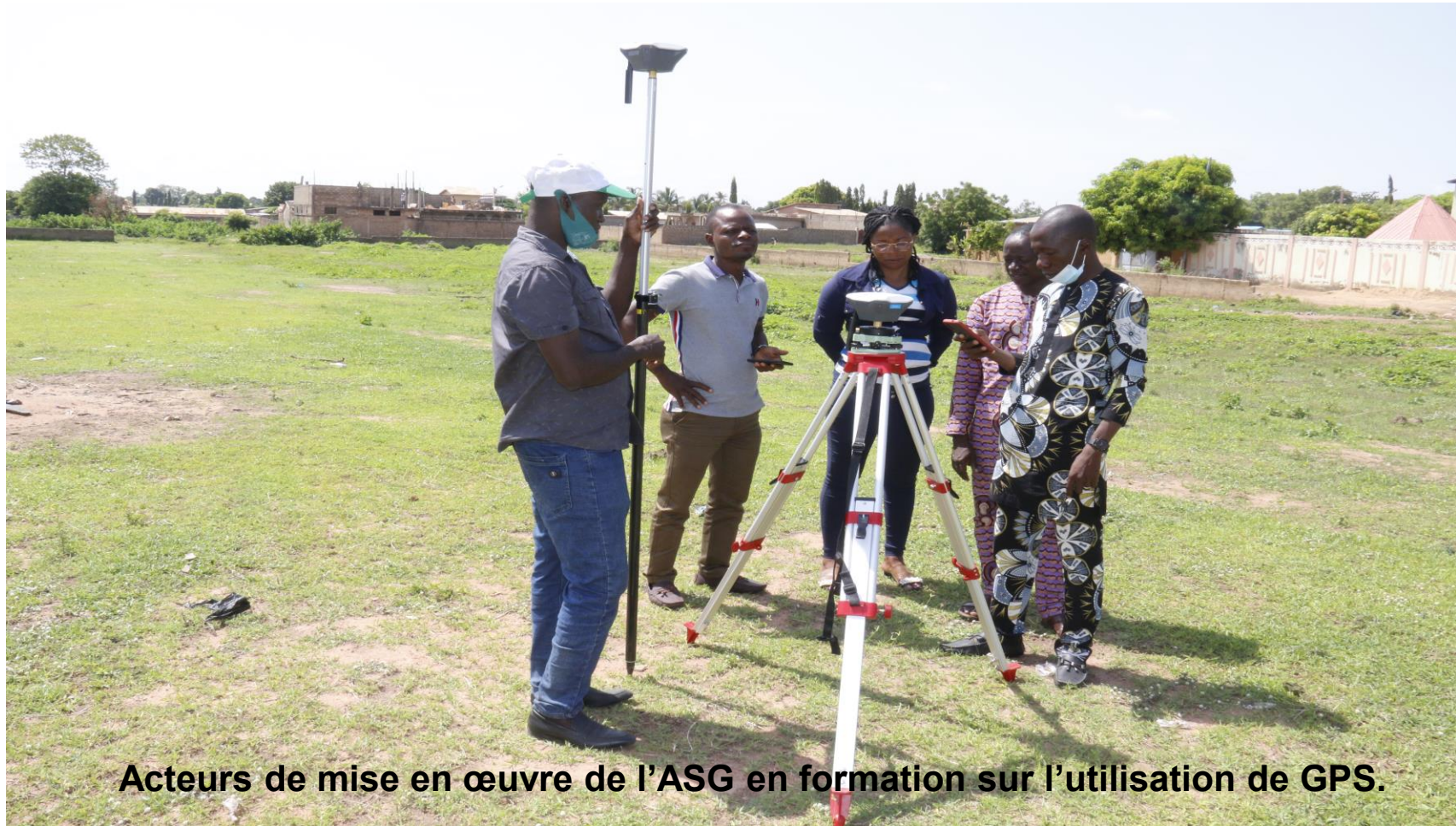
Acteurs de mise en œuvre de l'ASG en formation sur l'utilisation de GPS.